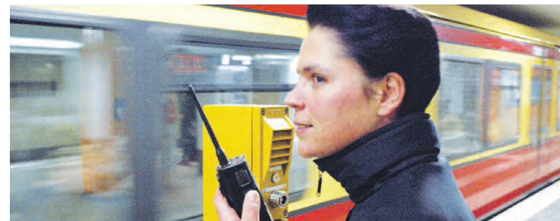
Ein Bild aus längst vergangenen Zeiten: Aufsichtspersonal am S-Bahnhof.

lich könnte die Nutzung des Fahrrads für viele Menschen eine interessante Alternative sein, die heute noch vor allem auf ihr Auto setzen. Ein Problem sieht Evers allerdings in der chaotischen Radverkehrspolitik des rot-roten Senats: „Das Berliner Radwegenetz ist ein Flickenteppich und nicht gerade ein Anreiz, auf das Fahrrad umzusteigen. Hier werden wir im Falle eines Wahlsiegs am 18. September ganz neue Akzente setzen müssen, um die Versäumnisse des rot-roten Senats aufzuarbeiten.“