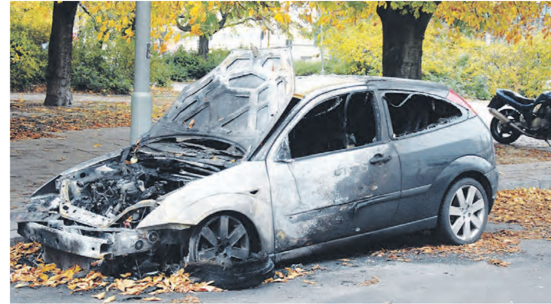
Fast täglich werden in Berlin Autos angezündet – hier das Wrack ein Ford Focus in Mitte.

Ein Brandanschlag am dichtbesiedelten Buckower Damm in Neukölln hätte letzgens beinahe zu einer Katastrophe geführt. Unbekannte zündeten einen Vattenfall-Transporter an, auf dem sich zwei gefüllte Gasdruckbehälter befanden.