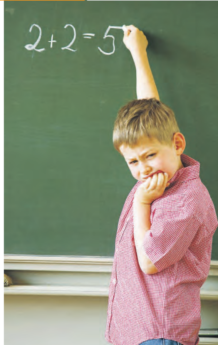
Zu wenig Lehrer, marode Schulen, falsche Reformen: Es wundert nicht, dass Berlins Schüler in den nationalen Leistungstests auf den hinteren Rängen landen.

Die Grundschulen brauchen besonders viel Augenmerk. Was hier versäumt wird, kann später nicht mehr aufgeholt werden. Es ist inakzeptabel, dass in der 5. und 6. Klasse bis zu 60 Prozent des Unterrichts nicht durch Fachlehrer unterrichtet wird und die Kinder dieser Schulstufen systematisch vom Ganztagsbetrieb ausgeschlossen werden. Ferner muss der Zwang zum Jahrgangübergreifenden Lernen abgeschafft und eine Sprachförderklasse vor Schuleintritt eingeführt werden.