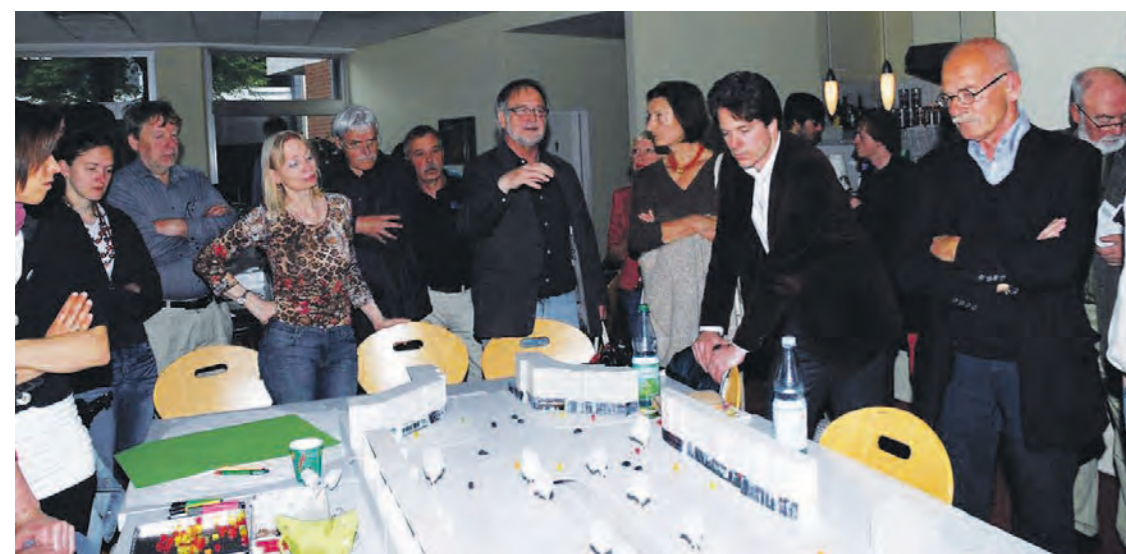
Die Ideenwerkstatt der Initiative Bundesplatz will den historischen Platz aufwerten.

Einig waren sich alle Politiker in ihrem Aufruf an die Zuschauer, am 18. September vom Wahlrecht Gebrauch zu machen und rechts- und linksextremistischen Parteien keine Chance zu geben.