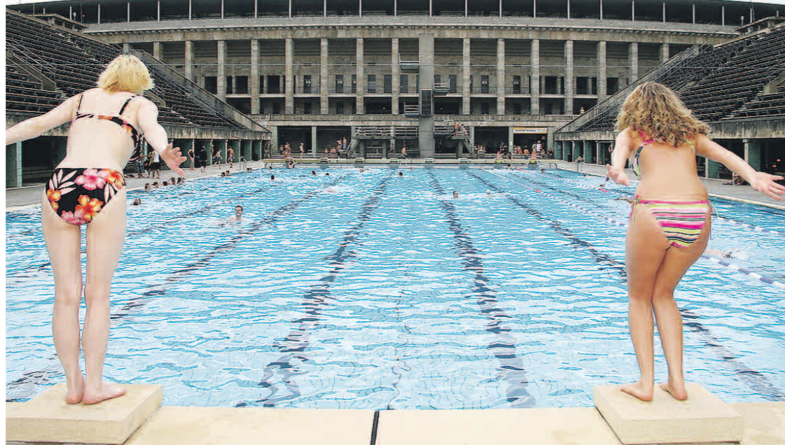
Das Olympia-Schwimmstadion muss dringend saniert werden.