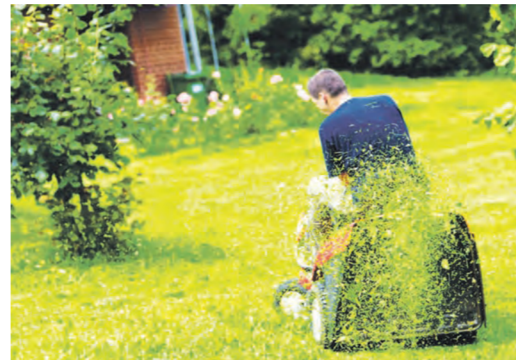
Die Freude an der neuen Parzelle kann manchem Hobbygärtner schnell vergehen, denn ist die Laube größer als 50 Quadratmeter, muss sie zurückgebaut werden.

Stellen Sie vor, dass Sie auf der Suche nach einer kleinen Parzelle mit einer schönen Laube sind. Sie finden ein schönes Grundstück, das Sie pachten wollen.