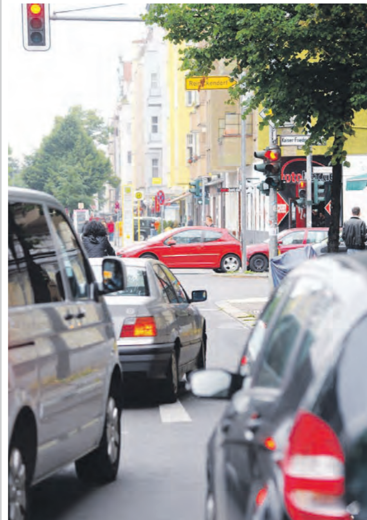
Die Straßenkreuzung Kant-/Kaiser-Friedrich-Straße ist für viele Autofahrer ein Ärgernis. Wer hier abbiegen will, wird durch geparkte Autos behindert. Das Ordnungsamt müsste öfter kontrollieren und härter durchgreifen, tut es aber nicht.