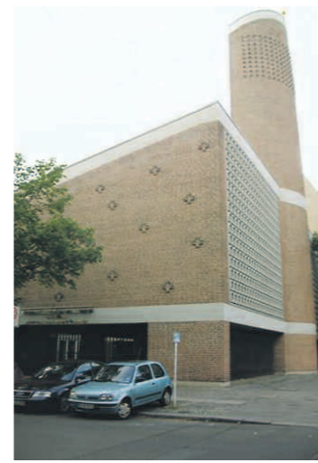
Die Syrische Kirche in der Mindener Straße.