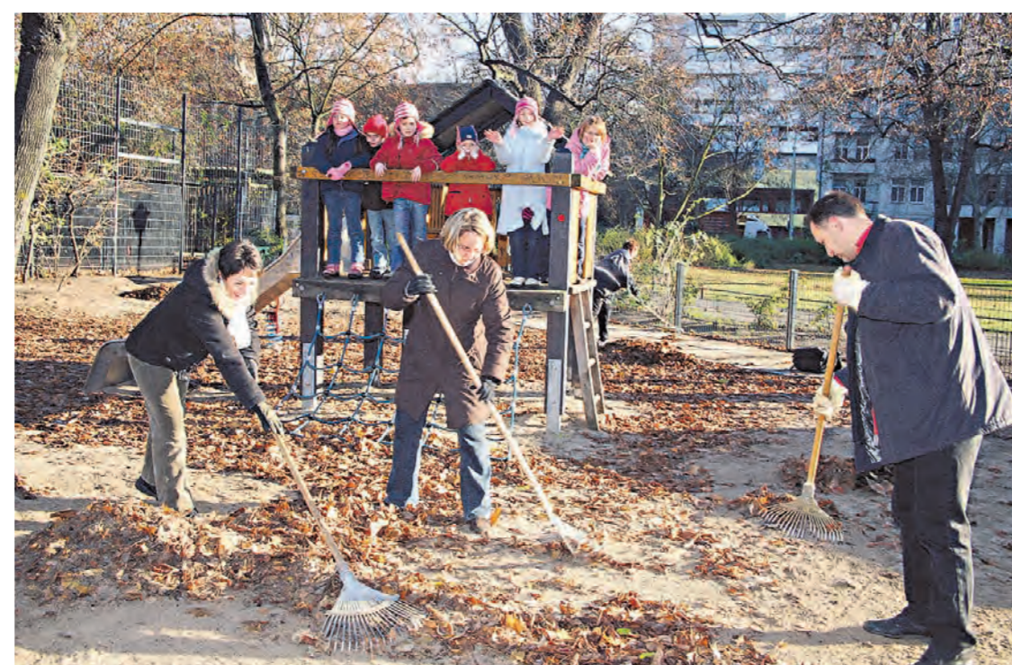
Aufopferungsvoll und zu jeder Jahreszeit hatten Mitglieder der Bürgerinitiative Fasanenplatz in den vergangenen Jahren um die Gerhart-Hauptmann-Anlage gekümmert. Umso größer ist jetzt ihre Enttäuschung angesichts der Kehrtwende durch SPD und Linke in der BVV.