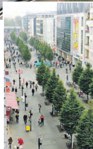
Belebt und beliebt wie eh und je: die Wilmersdorfer Straße.

Durch ein großzügig angelegtes Sanierungs- und Modernisierungskonzept des Bezirks und mit Unterstützung von ansässigen Geschäftsinhabern konnte die Fußgängerzone Wilmersdorfer Straße langsam, aber stetig aus diesem Dornröschenschlaf erweckt und wieder zu einer aufstrebenden Geschäftsstraße verwandelt werden. Maßgeblichen Anteil daran haben der für das öf-