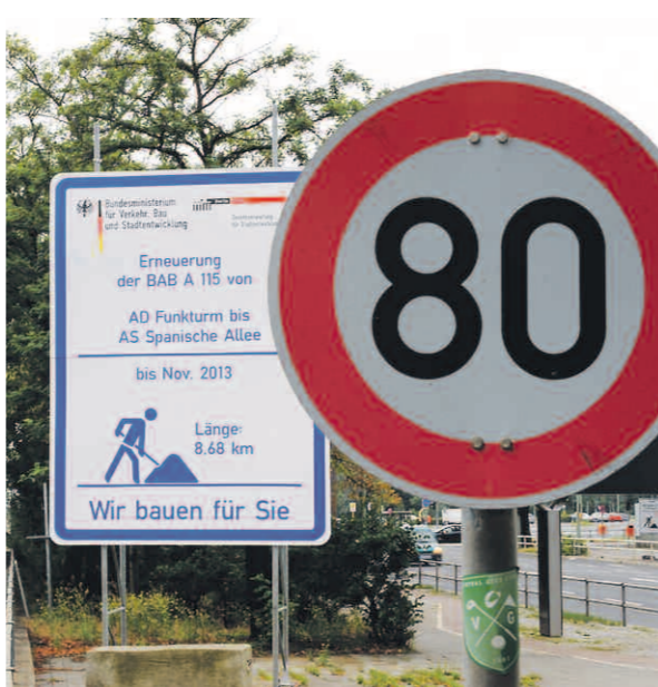
So reibungslos wie auf unserem Bild läuft der Verkehr rund um das Dreieck Funkturm seit einigen Wochen eher selten. Und das Nadelöhr bleibt den Berlinern noch lange erhalten, schließlich wird die A15 bis November 2013 saniert.

Und die Situation kann sich noch verschlimmern: Die Messe hat ihr Ziel erreicht und darf durch Zuarbeit des rot-roten Senats das Denkmal (!) Deutschlandhalle abreißen und mit einem temporären Ersatzbau bebauen, der auch für Kongresse während der Sanierung des ICC genutzt werden kann. Unnötig zu sagen, dass auch dadurch wieder Parkfläche verloren geht, ohne dass sich Gedanken gemacht wurde, wo die dann noch zahlreicher in den Süden des Messegeländes strömenden Besucher parken sollen. Sie werden wohl schnell in das nördliche Eichkamp ausweichen, was niemand gutheißen kann.