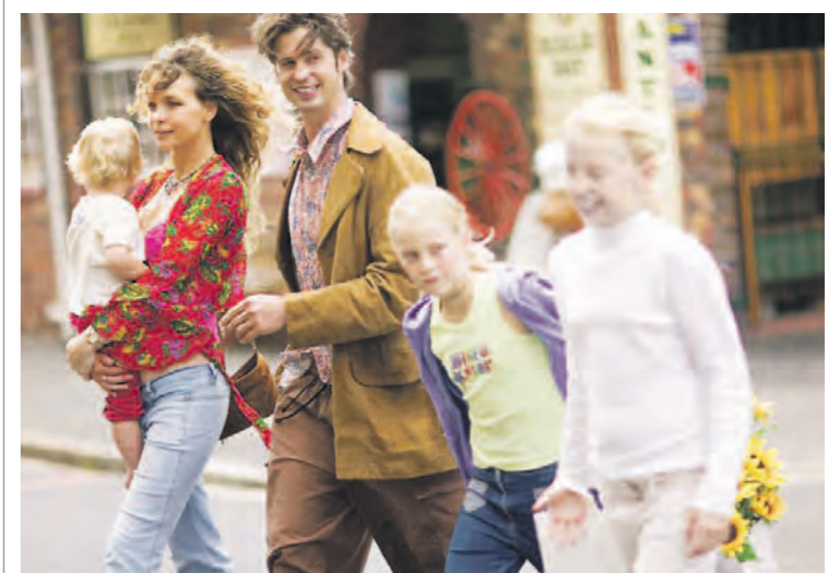
Charlottenburg-Wilmersdorf ist ein familienfreundlicher Bezirk.