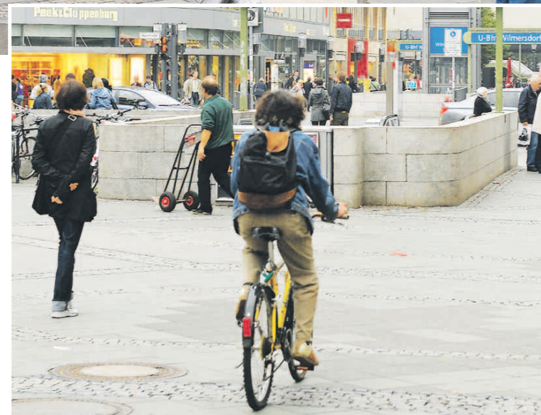
Das Fahrradfahren nervt viele Passanten. Schließlich ist die beliebte Einkaufsmeile eine Fußgängerzone.

Durch das große gemeinsame, private sowie öffentliche Engagement in der Wilmersdorfer Straße, das beispielhaft für eine vernünftige Stadtentwicklungs- und Baupolitik in unserem Bezirk ist, hat der Bezirk nun neben der beliebtesten Einkaufsmeile Berlins, nämlich dem Geburtstagskind Kurfürstendamm, auch noch die