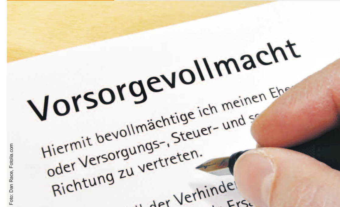
Durch die Vorsorgevollmacht kann eine gesetzliche Betreuung verhindert werden.