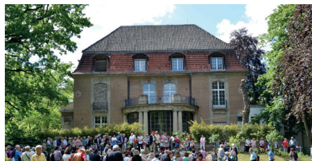
Ulme 35 - Raum für Kunst und Kultur

Ein Haus für Begegnung, für alte und neue Nachbarn sowie interreligiösen Dialog, Bildungsarbeit, mit Raum für Kunst und Kultur. Ein Verein hat vor drei Jahren das Haus in Westend übernommen und hat sich seit dem zu einem verlässlichen Partner im Bezirk etabliert. Die Willkommenskultur wird hier großgeschrieben, gelebt und weiterentwickelt.