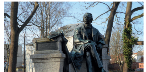
Romanschreiber und streitbarer Mensch: Theodor Fontane