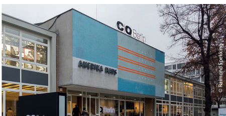
C/O Berlin - aktuelle Ausstellung zur Berliner Klubkultur

On the Dancefloor! – Die aktuelle Ausstellung im C/O Berlin lädt ein, um die Geschichte der Berliner Klubkultur seit dem Fall der Berliner Mauer zu betrachten.